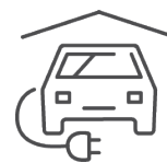
E-Car Ladestation (Vorbereitung)