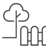
Freiflächen (Garten, Balkon, Terrassen)